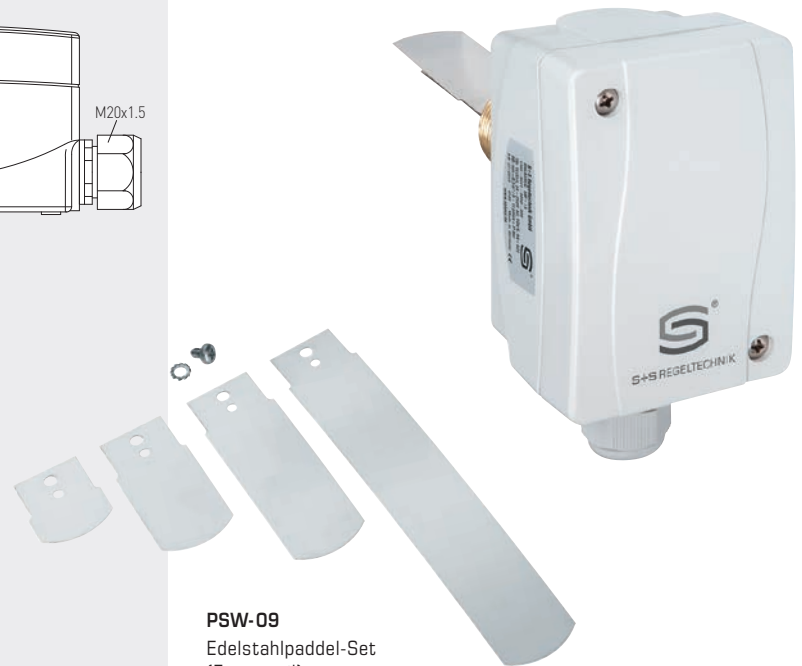
PSW-09 Edelstahlpaddel-Set (Ersatzteil)