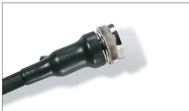
Série 150 rétreinte sur un connecteur.