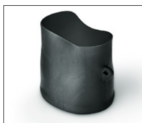
Série 150 avant rétreint.