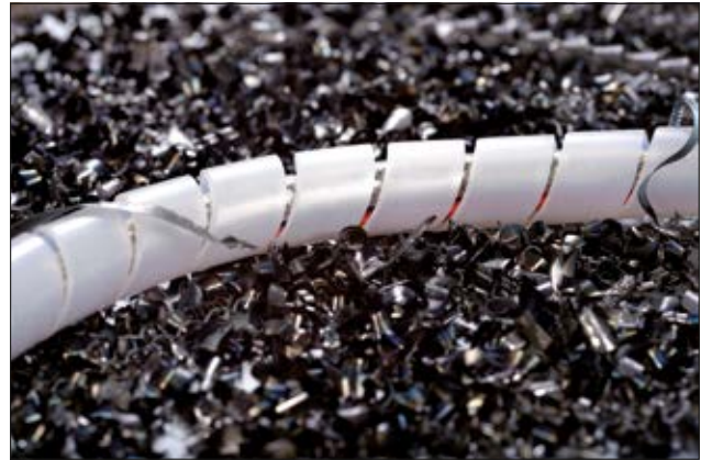
SPBA Spiralschläuche bieten optimale Abriebfestigkeit.