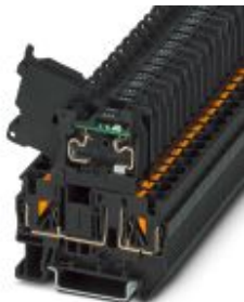
Hebelsicherungsklemme, Farbe schwarz, für 5 x 20 mm G-Sicherungseinsätze, mit LED für 24 V AC/DC

Bitte beachten Sie, dass die hier angegebenen Daten dem Online-Katalog entnommen sind. Die vollständigen Informationen und Daten entnehmen Sie bitte der Anwenderdokumentation. Es gelten die Allgemeinen Nutzungsbedingungen für Internet-Downloads. ( http://phoenixcontact.de/download )