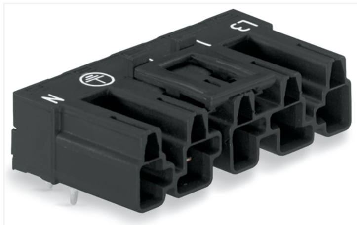
Couleur: ■ noir