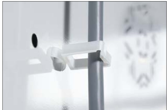
WPC-Kabelhalter mit Steckanker.