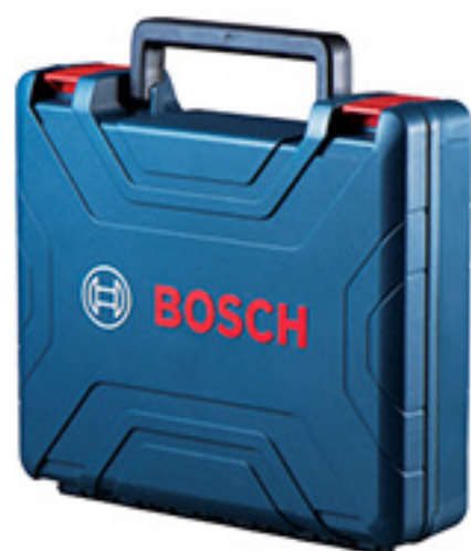
博世新款原装塑盒