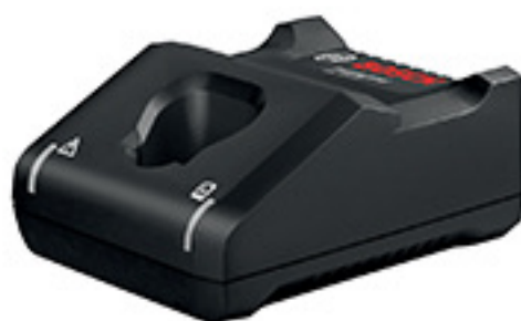
GAL 12V-40 快充