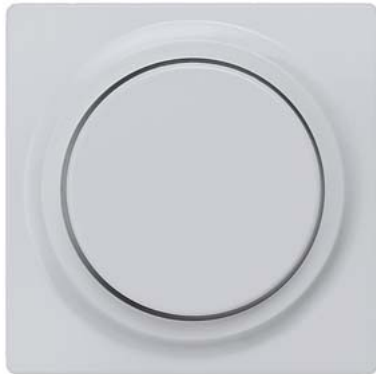
DELTA i-system aluminiummetallic Abdeckplatte für Dimmer mit Drehknopf 55x55mm