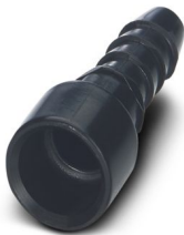
气动插座，用于HC-M-PN3模块，内部软管直径4.0 mm

请注意，本PDF文档中所示数据均生成自在线目录。完整数据请见用户文档。我们的一般下载使用条款已生效。