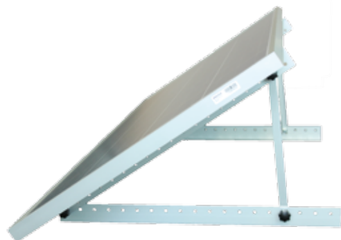
Mono Axial Two