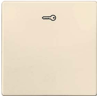
DELTA i-system elektroweiß Wippe mit Symbol Türöffner 55x55mm