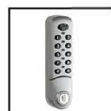
Serrure électronique COSERELEC