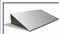
Coiffes inclinées Obligatoires en industrie agroalimentaire, elles assurent de meilleures conditions d'hygiène