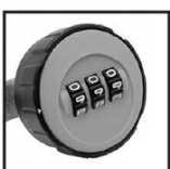
Serrure à code ronde 3 molettes