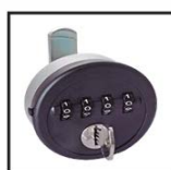
Serrure à code avec décodage clé