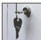
Serrure à clés