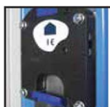
Serrure monnayeur 1€