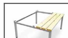
Socles bancs Piètements en tube 25 x 25 mm avec vérins de réglages