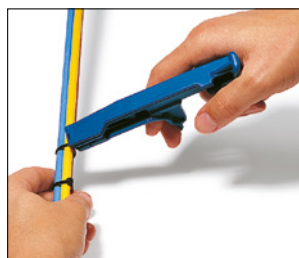
Kutt ved å vri verktøyet.