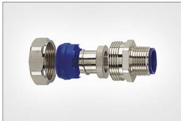
HelaGuard LTS-FMC starre Kompressionsverschraubung.