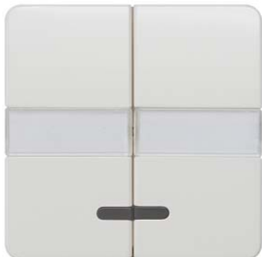
DELTA profil titanweiß Wippe 2-fach mit Schriftfeld und Fenster 65x65mm