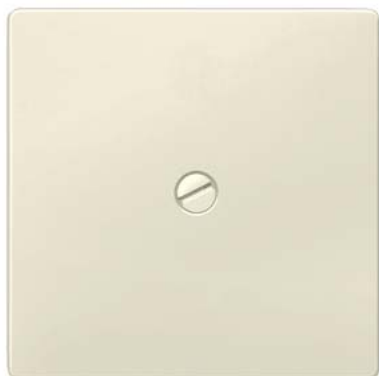
DELTA i-system elektroweiß Wippe schraubbar 55x55mm