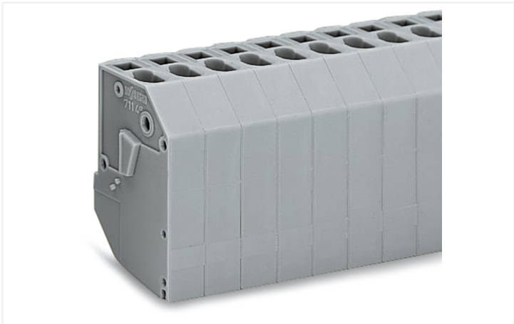
Couleur: ■ orange Identique à la figure

Les bornes pour transformateurs portant le numéro d'article 711-179, garantissent une installation électrique impeccable. Ces bornes pour transformateurs nécessitent une longueur de dénudage comprise entre 9 et 10 mm pour le raccordement au conducteur. Ce produit utilise la technologie CAGE CLAMP®. La connexion universelle, aujourd'hui connue sous le nom de CAGE CLAMP®, représente la norme industrielle en matière de connexion électrique et de technologie de connexion. Les dimensions sont 67,5 x 35 x 23,5 mm en largeur x hauteur x profondeur.