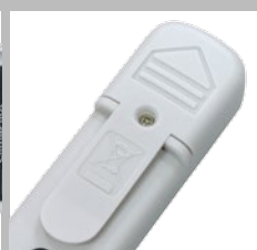
Support de fixation