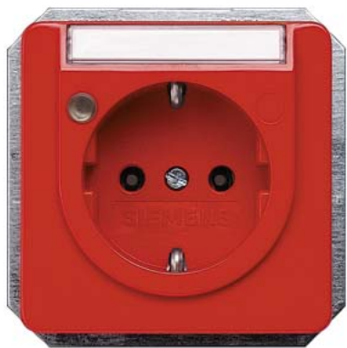
DELTA profil orange (ZSV) SCHUKO Betriebsanzeige, Schriftfeld 10/16A 250V 65x 65mm