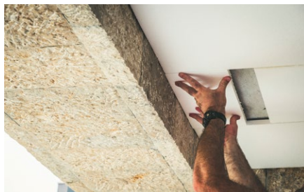
Installazione di pannelli, fregi decorativi, soglie e davanzali.