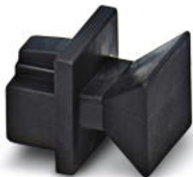
Capuchónes roscados protectoras contra polvo, para hembra RJ45

Tenga en cuenta que los datos indicados aquí proceden del catálogo en línea. Los datos completos se encuentran en la documentación del usuario. Son válidas las condiciones generales de uso de las descargas por Internet. ( http://phoenixcontact.es/download )