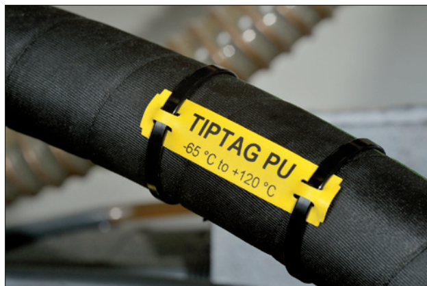
Duurzaam bedrukt plaatje voor in ruwe omstandigheden.