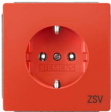
DELTA style orange SCHUKO mit Bedruckung "ZSV" 68x68mm 10/16A 250V