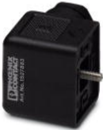
阀连接器, 4-芯, A 阀插头, 螺钉连接, 电缆密封 Pg9, 电缆外径 6 mm ... 8 mm

Please be informed that the data shown in this PDF Document is generated from our Online Catalog. Please find the complete data in the user's documentation. Our General Terms of Use for Downloads are valid ( http://download.phoenixcontact.com )