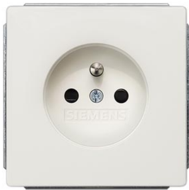
DELTA style platinmetallic SCHUKO Mittenschutzkontakt mit Kinderschutz 2-pol. nach CEE 7