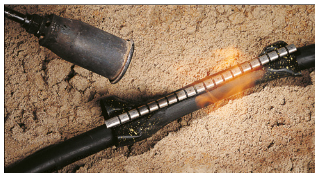
Manchet for kabelreparation - for sikker og hurtig reparation på stedet.