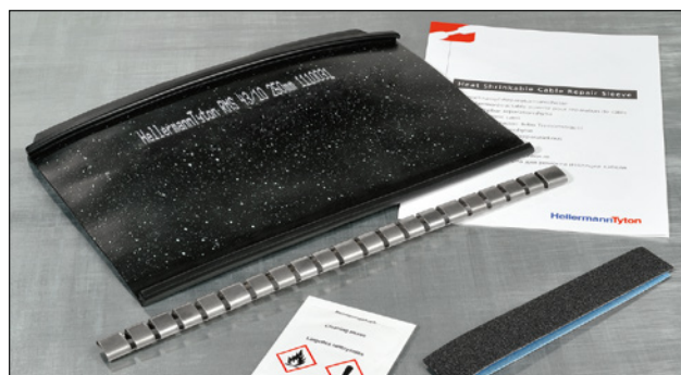
Sæt bestående af krympemanchet, lukkeskinne, rengøringsserviet, smergellærred og vejledning.