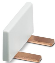
插拔式桥接件，针距: 17.8 mm，位数: 2，颜色: 浅灰

请注意，本PDF文档中所示数据均生成自在线目录。完整数据请见用户文档。我们的一般下载使用条款已生效。