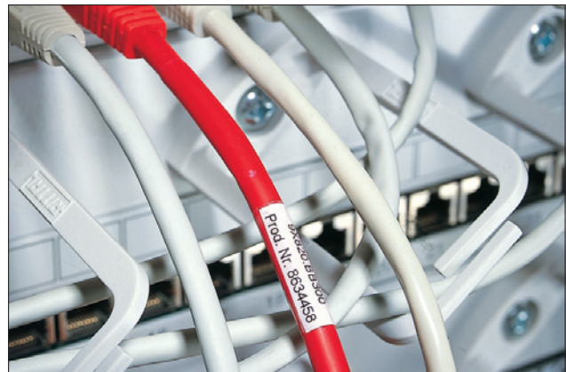
Zelflaminerende labels bieden bescherming tegen slijtage en omgevingsinvloeden.