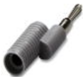
径変換プラグ, 色: 灰