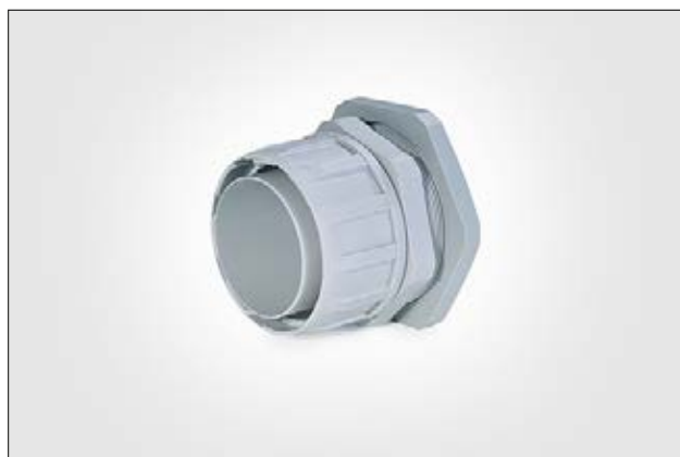
Raccord avec filetage tournant FG.