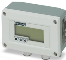
Ausgangsschleifengespeicher Prozessanzeiger im Feldgehäuse. HART

Bitte beachten Sie, dass die in diesem PDF-Dokument angezeigten Daten aus unserem Online-Katalog generiert wurden. Bitte finden Sie die vollständigen Daten in der Benutzer-Dokumentation. Es gelten unsere Allgemeinen Nutzungsbedingungen für Downloads.