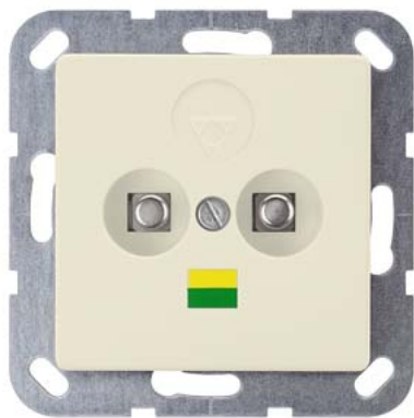
DELTA i-system elektroweiß Doppel-Potential-Ausgleichsdose 55x55mm