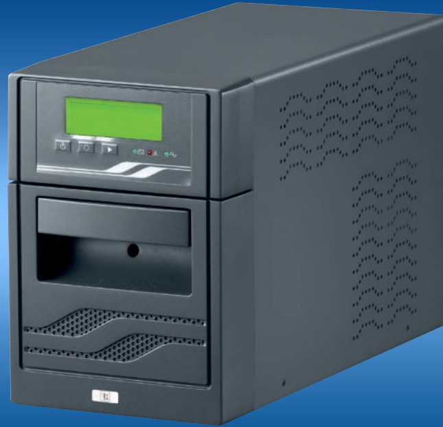
EA-UPS INFC 1000