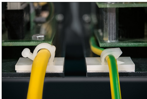
Clips adhésifs des séries RA et RB, en application.