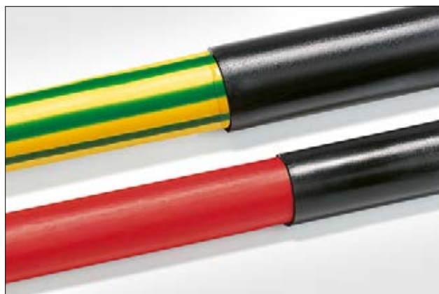
Les gaines à paroi adhésive TA32 et TA42 sont homologuées UL224.

i Disponible également en manchons sur demande. Contactez-nous !