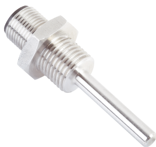
Afbeelding kan afwijken