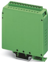
电子模块外壳，用于接插PCB，带12位Combicon针脚排

请注意，本PDF文档中所示数据均生成自在线目录。完整数据请见用户文档。我们的一般下载使用条款已生效。