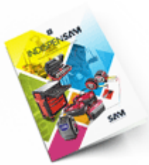
Les outils Indispensables 2021

Découvrez tous nos produits dans nos catalogues en ligne