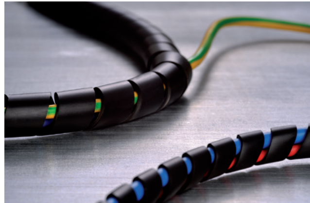
SBPAV0-spiraalslang wordt gebruikt als brandbescherming een belangrijke rol speelt.

Spiraalslang vervaardigd uit standaard polyamide 6 kunt u vinden in de Algemene catalogus.