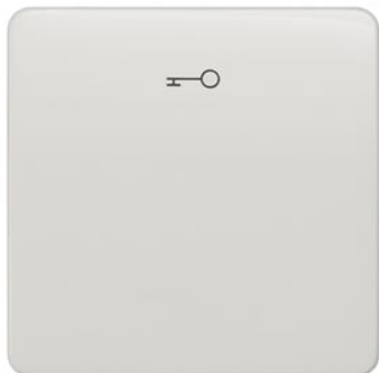
DELTA profil titanweiß Wippe mit Symbol Türöffner 65x65mm