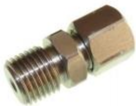
(BSP parallel example - 381-7362, see below for other sizes)