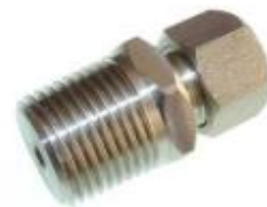
(BSPT tapered example – 286-787, see below for other sizes)