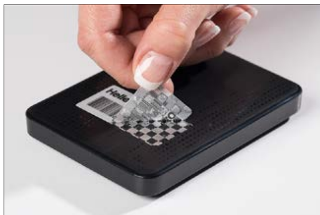
Originalitätsschutz. Das Etikett ist nicht übertragbar.