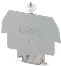
可密封盖板，安装在NS 35/7,5 DIN导轨上，用于AP 3保护盖，带塑料M5滚花螺母，空间要求：2 mm

请注意，本PDF文档中所示数据均生成自在线目录。完整数据请见用户文档。我们的一般下载使用条款已生效。