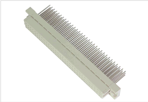
图片仅用于说明。请参考产品描述。