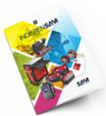
Les outils Indispensables SAM 2021