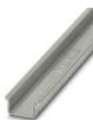
Carril simétrico sin perforar, Perfil estándar 2,3 mm, anchura: 35 mm, altura: 15 mm, según EN 60715, material: Acero, galvanizado, pasivado de capa gruesa, longitud: 2000 mm, color: plateado

Carril simétrico sin perforar - NS 35/15-2,3 UNPERF 2000MM - 1201798