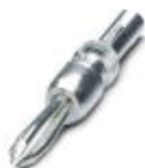
Clavija de pruebas, con conexión por soldadura hasta sección de cable de 1 mm 2 , color: gris