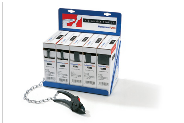
HIS Service Station.