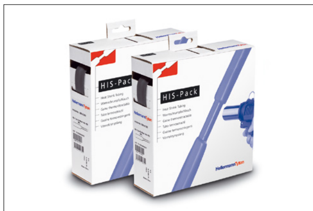
HIS-A avec adhésif et HIS-Pack.