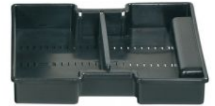
KIT TRAY MUB