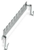
接地导轨，CTM保护插头连接LSA-PLUS断接条时使用。 型号：10个双导线

请注意，本PDF文档中所示数据均生成自在线目录。完整数据请见用户文档。我们的一般下载使用条款已生效。