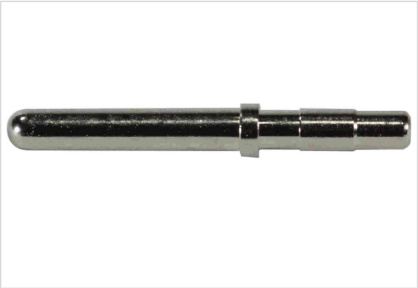
图片仅用于说明。请参考产品描述。